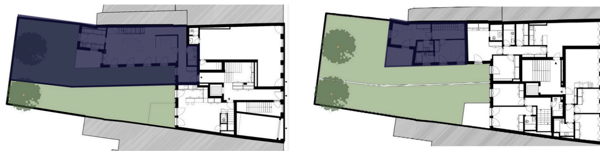
LOCALIZAÇÃO: PISO 1/2