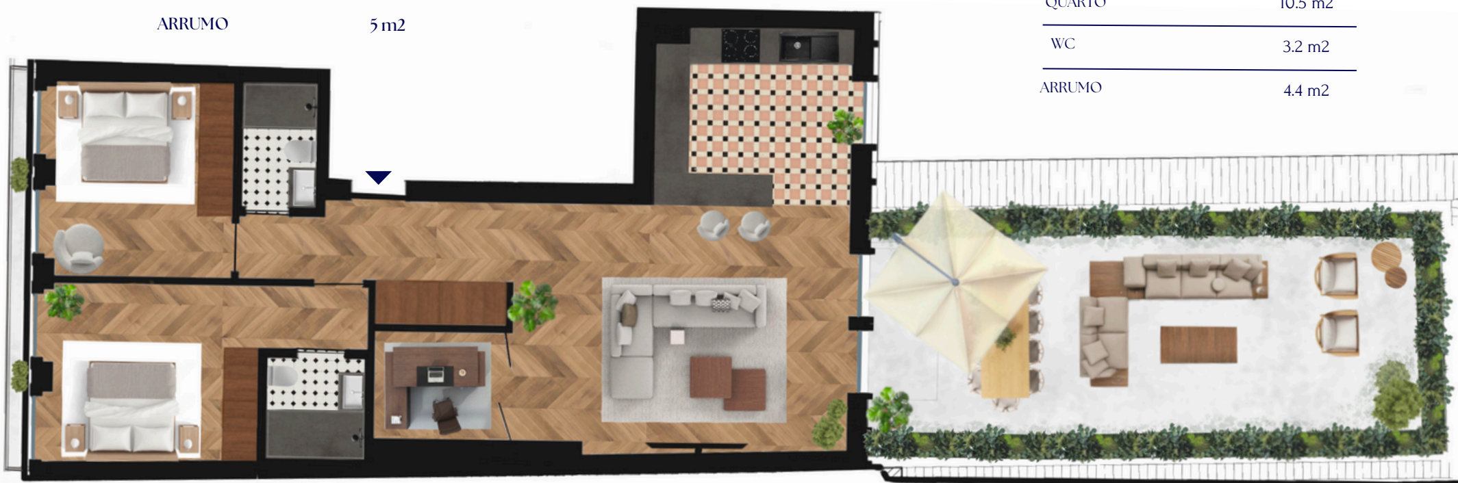
PLANTA DA FRAÇÃO